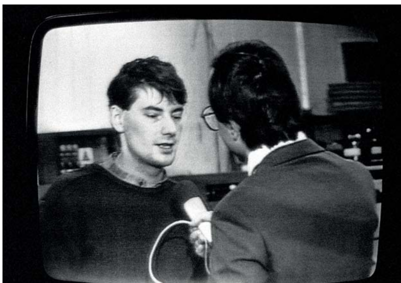
Rozhovor v ČT, 1986.

Po ukončení studia jsem šel na rok na vojnu a pak v roce 1981 nastoupil na vědeckou aspiranturu do