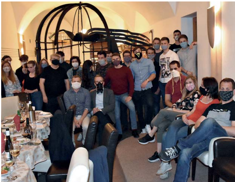
Oslava na konci semestru v Hradci Králové, 2020.