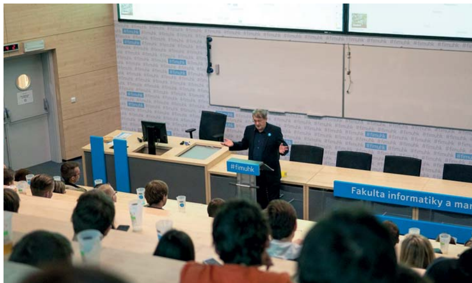
Přednáška na Fakultě informatiky a managementu v Hradci Králové, 2018.